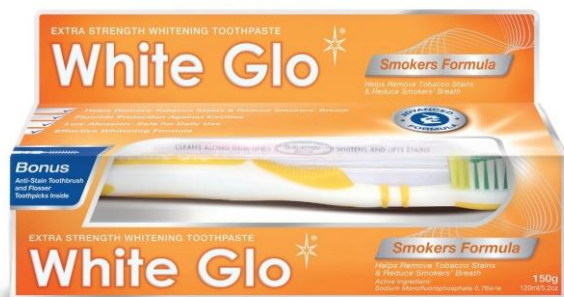
Пластиковая туба 150гр