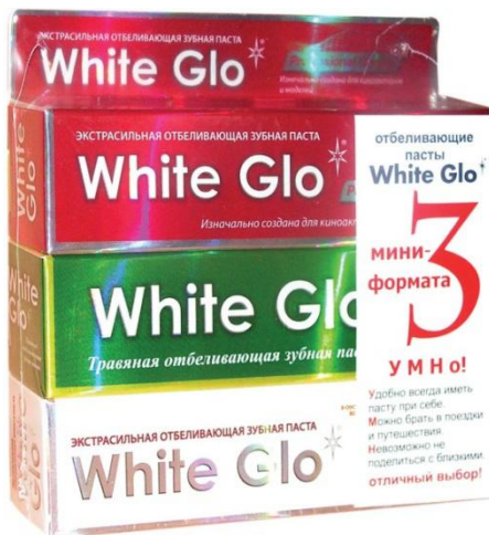
Набор мини-упаковок зубных паст