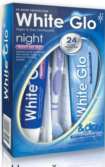
Ночной гель и дневная паста