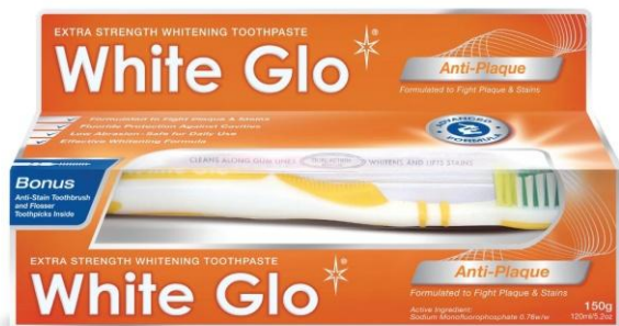
Пластиковая туба 150 гр