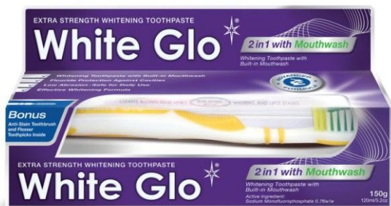
Пластиковая туба 150гр