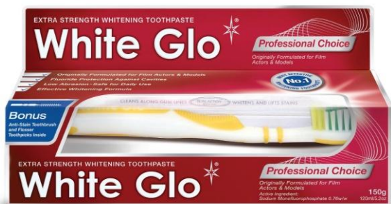
Пластиковая туба 150 гр