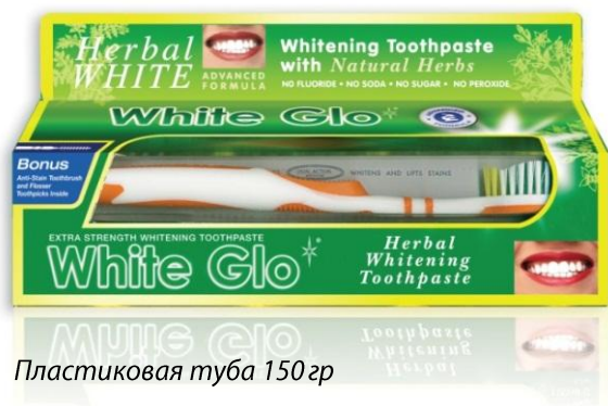
Пластиковая туба 150гр